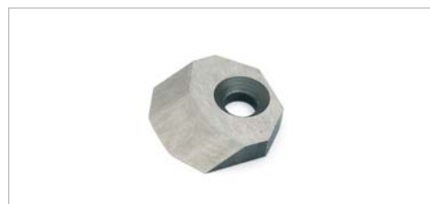
8800408 – Reservekniv for FBS17250, 17 graders